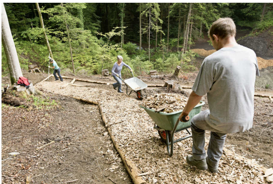
Dimanche 2 août, des bénévoles ont recouvert de copeaux la piste Vita des Grottes.

Sport Initié il y a quatre ans par une association locale, le projet de parcours avance à petits pas. Les habitants retroussent leurs manches.